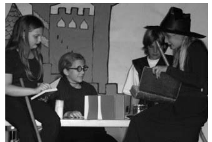
Der Zauber des Harry Potter