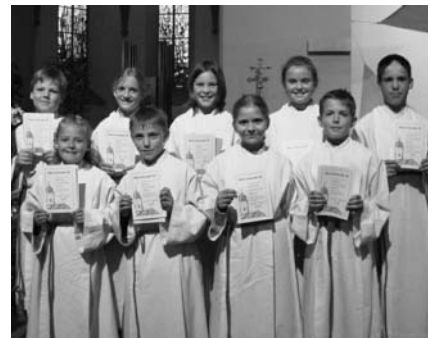
Die neuen Mini mit der Aufnahme-Urkunde

chen selbstgebackenen Kuchen und erfrischenden Getränken verwöhnt. So mancher rundete den Abend mit einer gemütlichen Plauderstunde ab. Ein Dank gilt den jungen Leuten, die dies erst alles ermöglichten. Denn es ist nicht selbstverständlich, einen Teil seiner Freizeit zu geben, die Kinder und Jugendlichen zu betreuen, im Team zu motivieren und eine tolle Arbeit zu leisten. Macht weiter so!