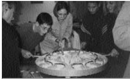
Firmlinge beim Geschicklichkeitsspiel

Spielabende, Ausflüge, das Hüttenwochenende und die gute Gemeinschaft bei allen Treffen.