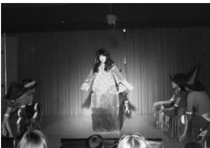
"Hexerei und Zauberei"!

Unter dem Motto "Hexerei und Zauberei" wurden die unterschiedlichsten Darbietungen gezeigt. Neben bekannten Größen wie die "Ghostbusters" durfte natürlich auch der