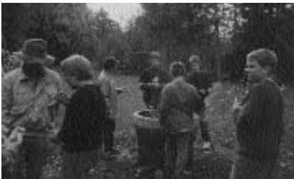
Auch gegrillt wurde auf dem Firmweg!

Am 27. April 2002 fand im Pfarrsaal das letzte Treffen unserer Firmgruppen vor dem Intensivjahr statt. Der Firmweg ist somit abgeschlossen. Wir trafen uns um 17.00 Uhr unter der Kirche. Zuerst wurden wir um unsere eigene Meinung zu den letzten drei Jahren gebeten. Ein Leiter las eine chronologische Zusammenfassung aller bisherigen Treffen vor und am Ende jedes Jahres mussten alles sagen, was ihnen daran gut und weniger gut gefallen hat. Hier kam es zu recht unterschiedlichen Ansichten. Den größten Anklang fanden die