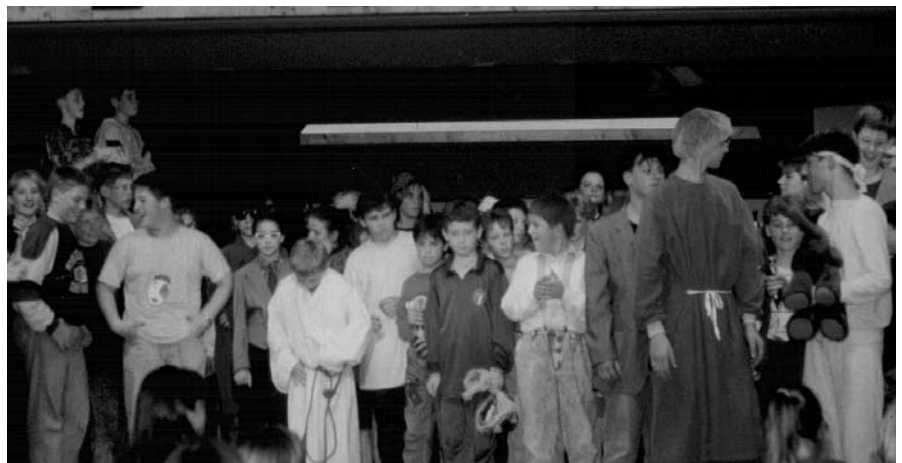
Es war einmal! Bunter Abend der Jung-schar