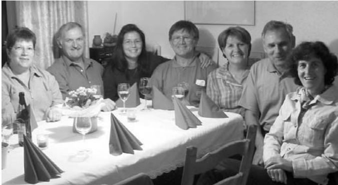
Nach getaner Arbeit war immer noch Zeit für gemütliches Zusammensein.

Vor vier Jahren haben wir uns als Firmbegleiter gemeldet, obwohl wir nicht genau wussten, was auf uns zukommt, denn wir waren absolute Neulinge auf diesem Gebiet. Heute, nach vier Jahren, müssen wir sagen, dass es schön war, wir haben viel Schönes und Gemeinschaft erlebt. Wir wünschen den Jugendlichen alles Gute für die Zukunft und hoffen, dass sie von den vielen Themen etwas für sich mitnehmen können. Wir möchten auch anderen Eltern Mut machen, sich auf diesen Weg