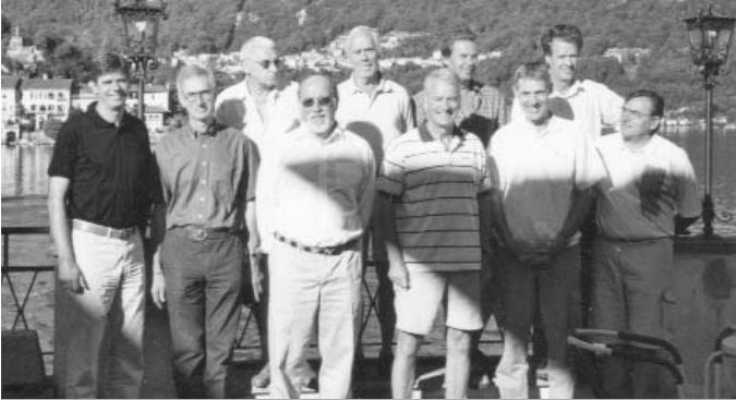
Auf der Terrasse des Hotels "Leon d'Oro", im Hintergrund die "Isola di San Giulio"

Der diesjährige Ausflug vom 29. August bis 1. September 2003 ins nördliche Piemont reiht sich würdig an die Ausflüge der letzten Jahre (1999 bis 2002) ins Tessin und Elsaß, nach Südtirol und Oberösterreich. Dabei ließ sich die Abfahrt am Freitagmittag nicht besonders gut an, da im Rundfunk von Unwetterkatastrophen und Straßensperren im Raum Bellinzona/Airolo berichtet wurde. Tatsächlich waren wir jenseits des San Bernardino von extremen Regengüssen, riesigen Wasserfällen und einem eine braune Brühe führenden