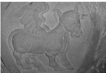
Der Stier als Lukas-Symbol am Taufbecken

Mit dem 1. Adventssonntag beginnt wieder ein neues Lese- und Kirchenjahr. Dabei liegt der Schwerpunkt der Wortverkündigung im Lukasevangelium. Der Evangelist Lukas, ein Heidenchrist, war ein hervorragender Erzähler und Schreiber. Er hat uns die hoffnungsvolle Heilungsgeschichte hinterlassen, die besagt, dass mit Jesus Christus eine entscheidende Wende zum Heil für alle Menschen eingetreten ist.