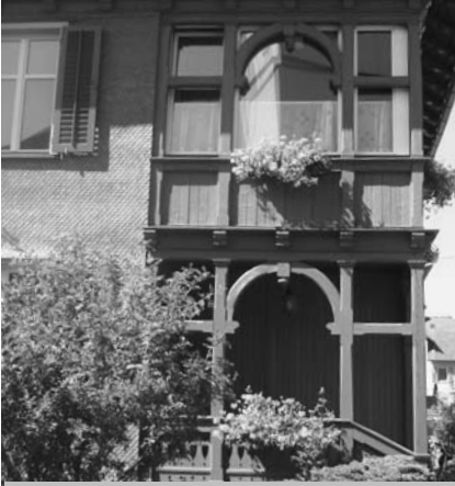
Der stilvolle Eingang ist ein Schmuckstück des Wohnheimes der Lebenshilfe.