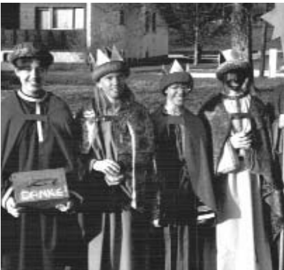
Göfner Sternsingergruppe (1992)