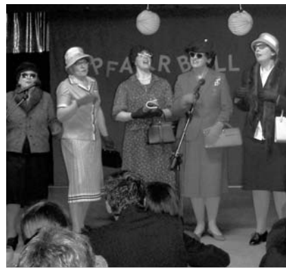
Die Büchereifrauen beim Pfarrball 2003