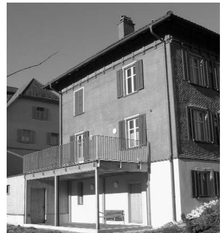
Renovierte Südost-Front mit neuem Balkon

Im Jahre 2002 erhielt das Haus nach einem Brand eine neue Schindelung, einen Balkon, neue Dachrinnen und eine neue Kücheneinrichtung. Die Waschküche und die Sanitäranlagen wurden ebenfalls saniert.