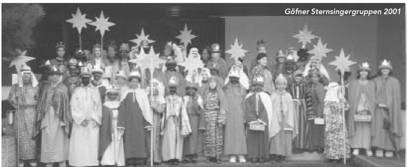
Göfner Sternsingergruppen 2001