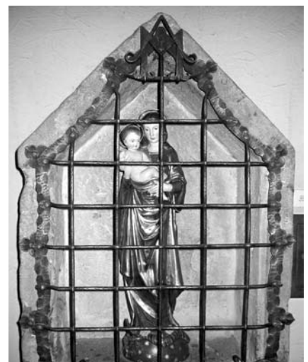
Marienstatue von 1519 in Maria Bildstein