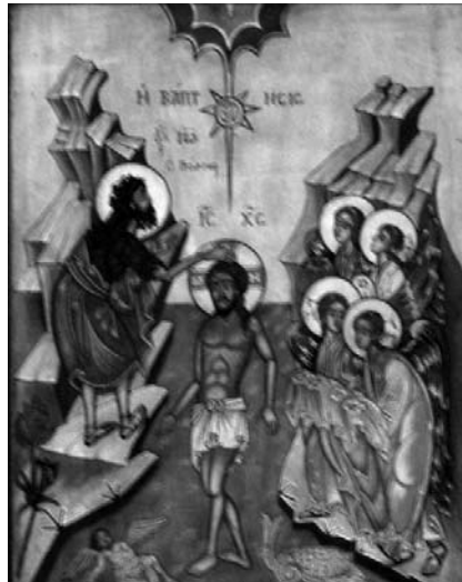
Taufkone in der Kriche als Erinnerung an die Verantwortlichkeit eines jeden Christen

die Gegebenheiten unserer Gemeinde im Kontext der Gesamtkirche, nahm mit Unterstützung vieler Göfnerinnen und Göfner Bedürfnisse der Menschen wahr, förderte die Laienarbeit und reagierte auf den Wertewandel der Zeit behutsam und