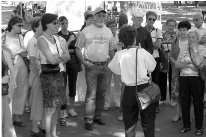
Stadtführung in Bologna

Genuss der raffinierten italienischen Küche - Stadtbummel, verbunden