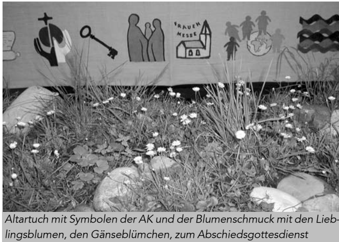
Altartuch mit Symbolen der AK und der Blumenschmuck mit den Lieblingsblumen, den Gänseblümchen, zum Abschiedsgottesdienst

denen Erneuerungen in der Liturgie und vor allem in der Sakramentenpastoral - Gölfner Modell der Hinführung zur Eucharistie und der Firm-