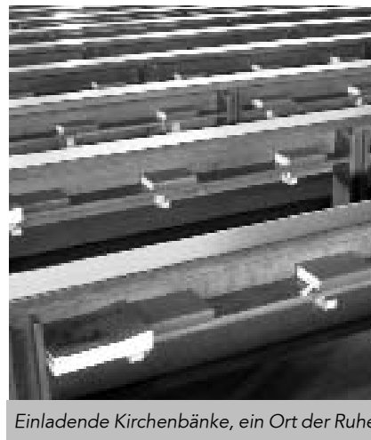
Einladende Kirchenbänke, ein Ort der Ruhe

Die Gottesdienste (Samstag VA und Sonntag) sind weiterhin zu den gewohnten Zeiten um 19.00 Uhr bzw. 9.30 Uhr.