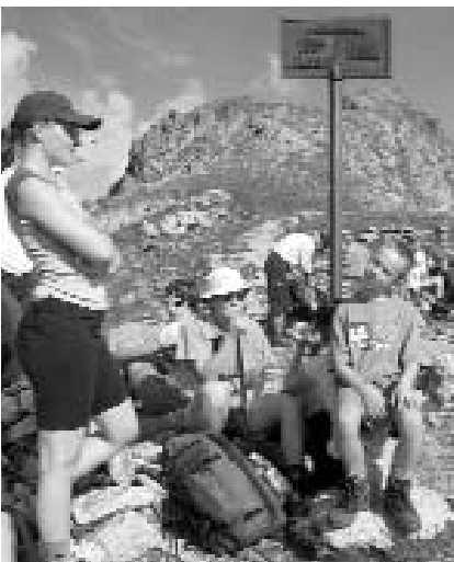
Radsattel, Landesgrenze Vorarlberg - Tirol,