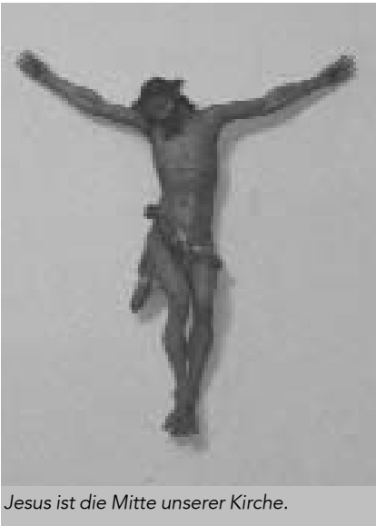
Jesus ist die Mitte unserer Kirche.