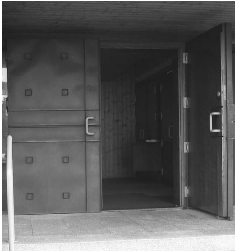
Die offene Tür unserer Pfarrkirche lädt alle Menschen unserer Pfarrgemeinde zu einem gemeinsamen Weg in die Zukunft ein.

sich immer mehr. Es ist nicht selbstverständlich, dass eine Gemeinde wie Göfis wieder einen Priester im