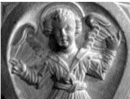
Engel als Matthäus-Symbol am Taufbecken

Mit dem 1. Adventssonntag beginnt wieder ein neues Lese- und Kirchenjahr. Dabei liegt der Schwerpunkt der Wortverkündigung im Matthäusevangelium. Der Evangelist Matthäus ist wahrscheinlich aus dem Kreis der Apostelschüler hervorgegangen. Er schreibt nach der Zerstörung Jerusalems, um 80-90 an Gemeinden und Gruppen, die verwurzelt im Judentum waren.